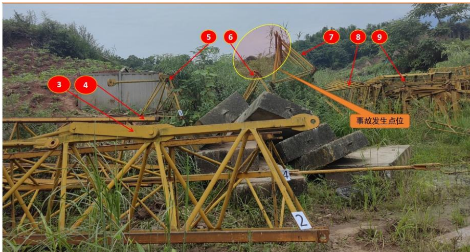
(图3 事故现场发生点位图)