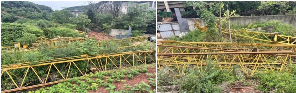
(图2 塔机主要金属结构构件连接体图)