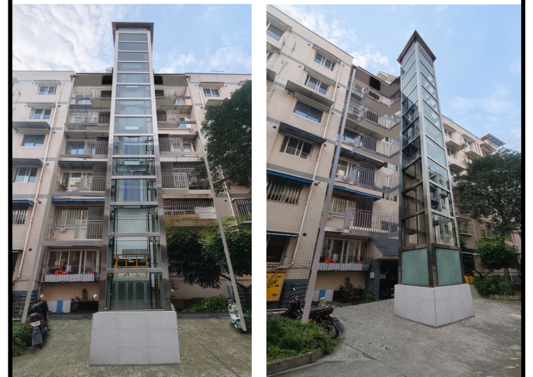
加装电梯后效果图