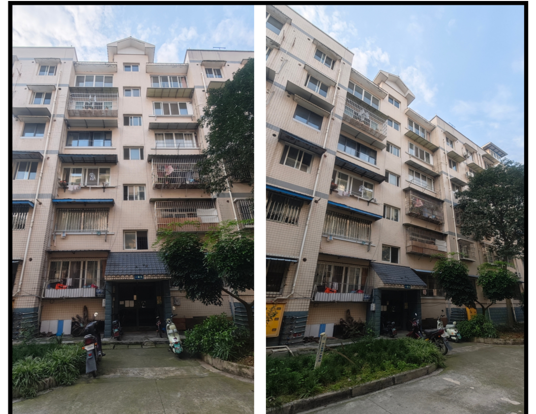
加装电梯前效果图