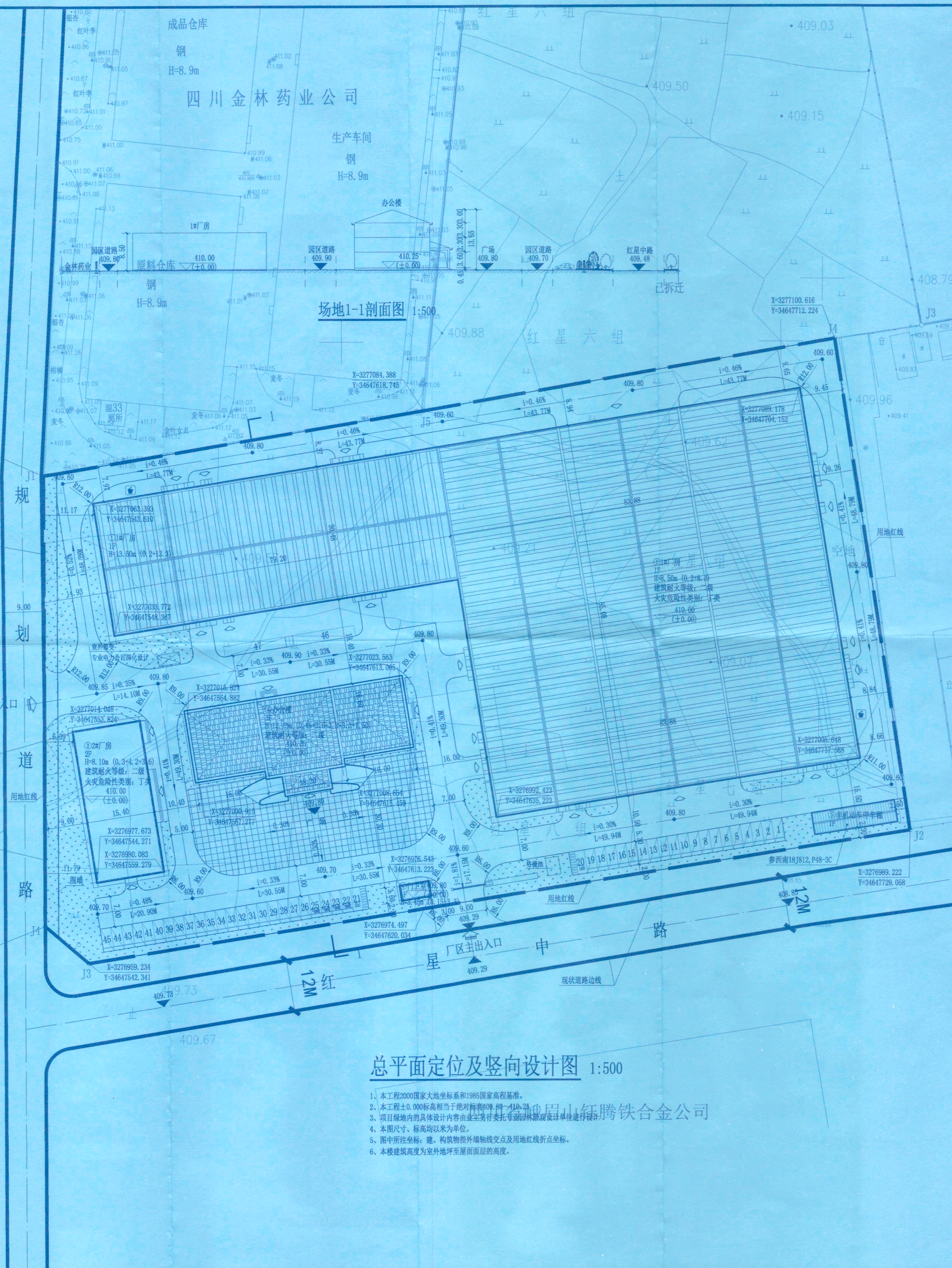
总平面定位及竖向设计图 1:500