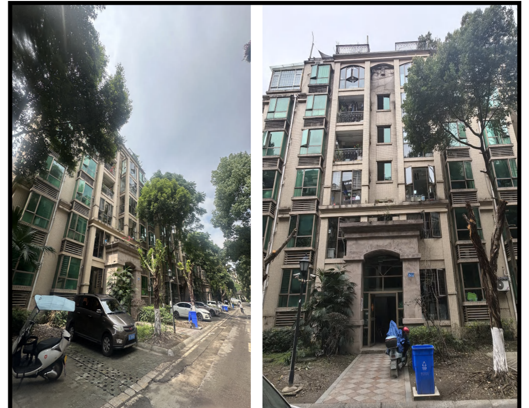
加装电梯前效果图