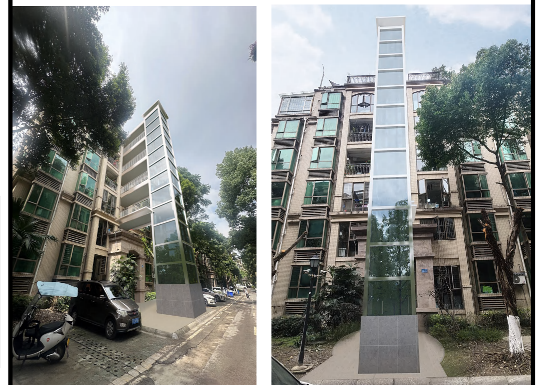
加装电梯后效果图