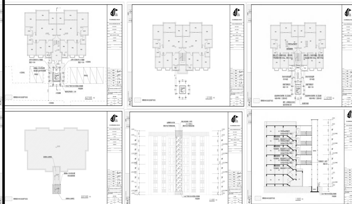
各层平面及立面图