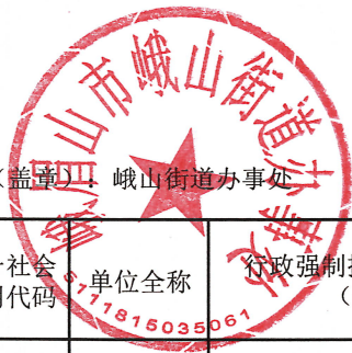
2024年度行政强制实施情况统计表