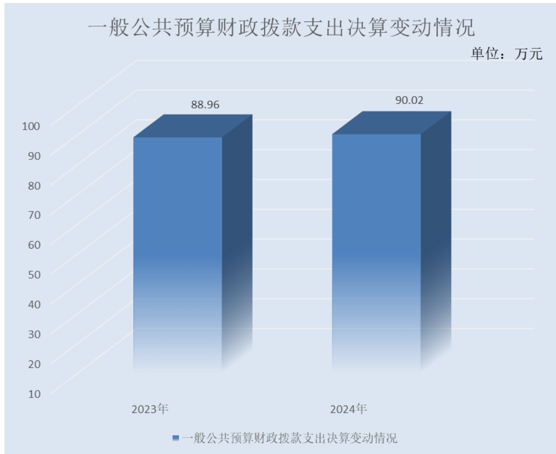
(图 5：一般公共预算财政拨款支出决算变动情况)(柱状图)