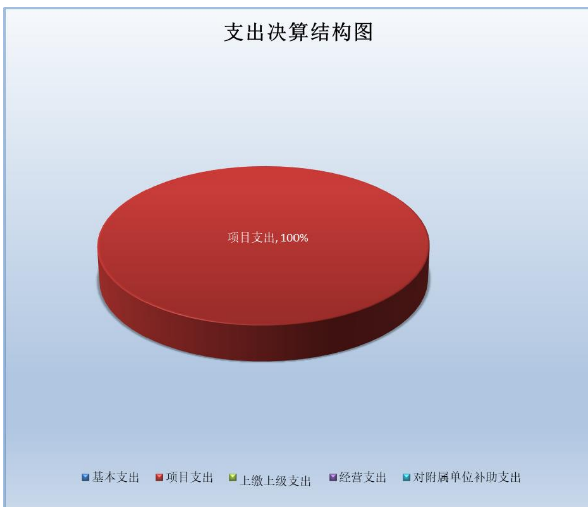
（图 3：支出决算结构图）（饼状图）

2024 年度本年支出合计 90.13 万元，其中：基本支出 0 万元，占 0%；项目支出 90.13 万元，占总支出的 100%；上缴上级支出 0 万元，占 0%；经营支出 0 万元，占 0%；对附属单位补助支出 0 万元，占 0%。