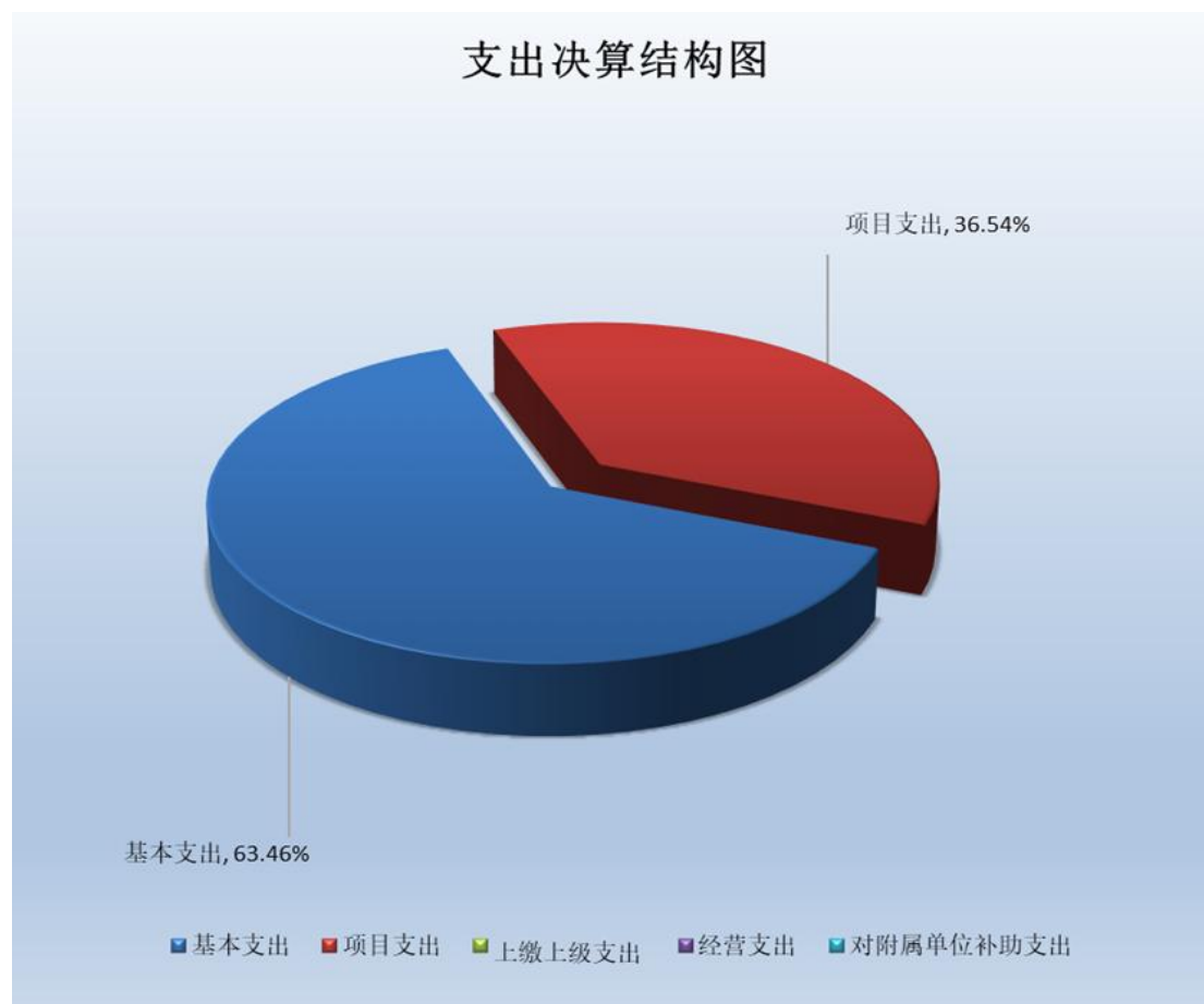
(图 3: 支出决算结构图) (饼状图)