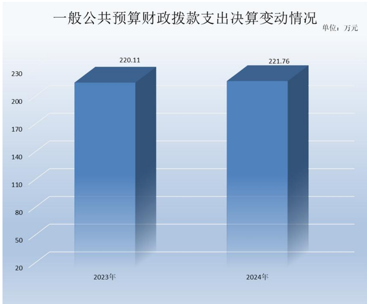
(图 5: 一般公共预算财政拨款支出决算变动情况)(柱状图)