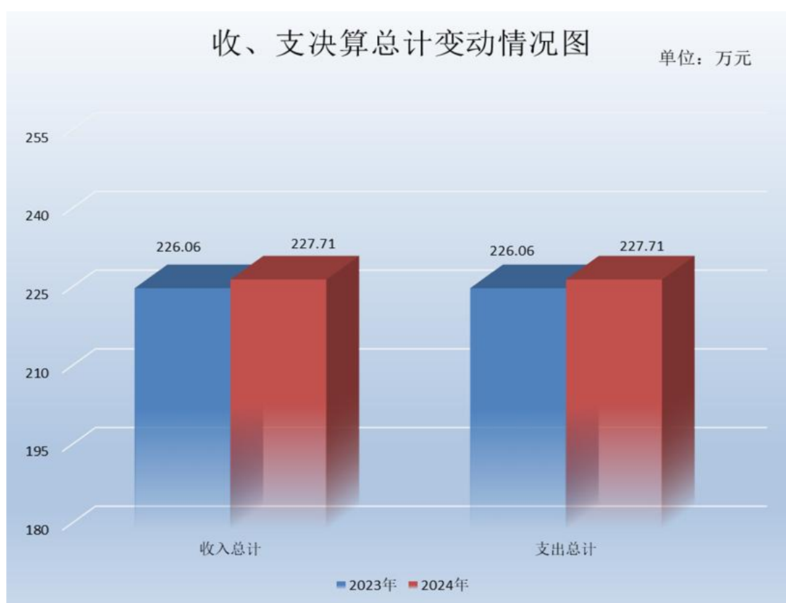
（图 1：收、支决算总计变动情况图）（柱状图）

2024 年度收入、支出总计均为 227.71 万元。与 2023 年度相比，收入、支出总计各增加 1.65 万元，增长 0.73%。主要变动原因是项目经费增加。