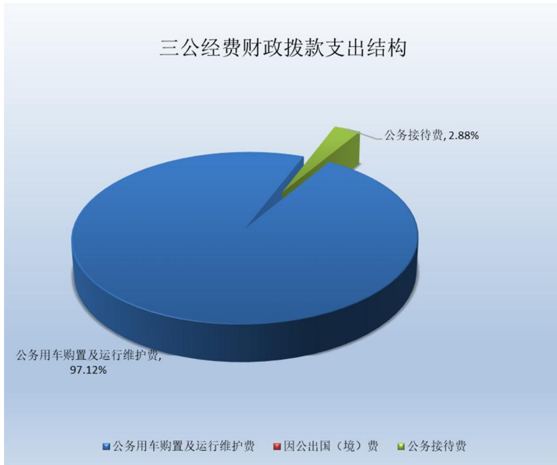
(图 7: “三公”经费财政拨款支出结构) (饼状图)

1.因公出国(境)经费支出 0 万元, 完成预算 0%。 全年安排因公出国(境)团组 0 次, 出国(境) 0 人。因公出国(境)支出决算比 2023 年增加 0 万元, 增长 0%。