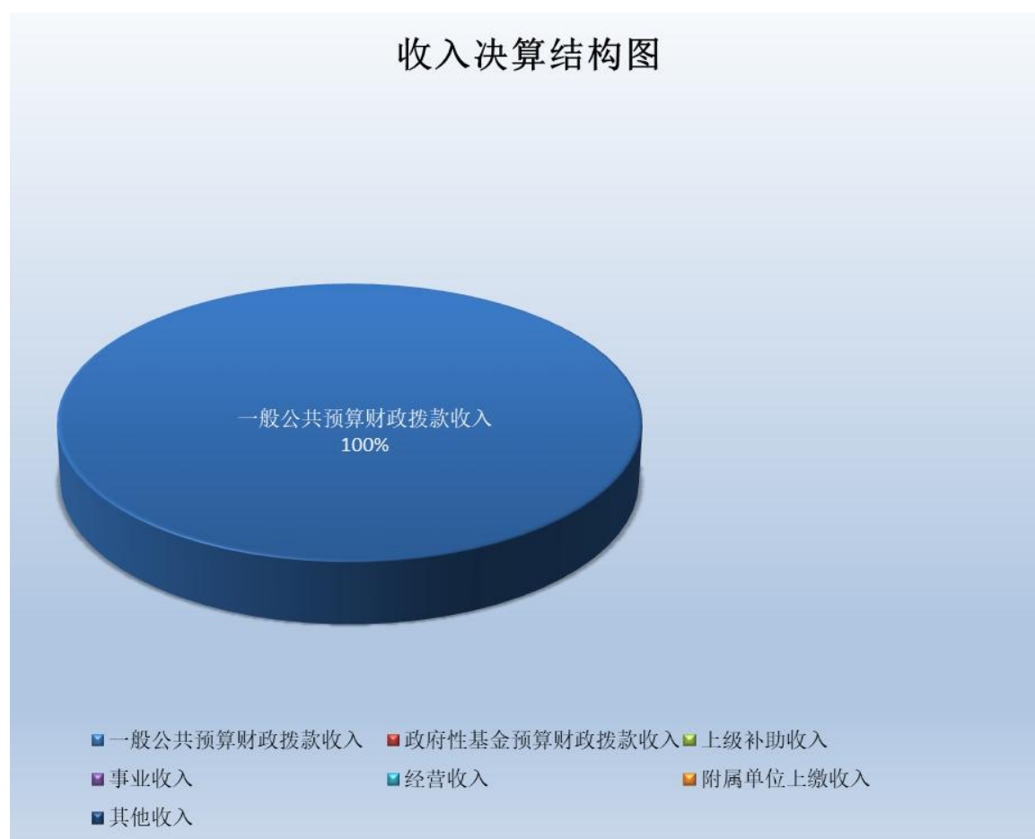
(图 2: 收入决算结构图) (饼状图)

财政拨款收入 0 万元，占 0%；国有资本经营预算财政拨款收入 0 万元，占 0%；上级补助收入 0 万元，占 0%；事业收入 0 万元，占 0%；经营收入 0 万元，占 0%；附属单位上缴收入 0 万元，占 0%；其他收入 0 万元，占 0%。