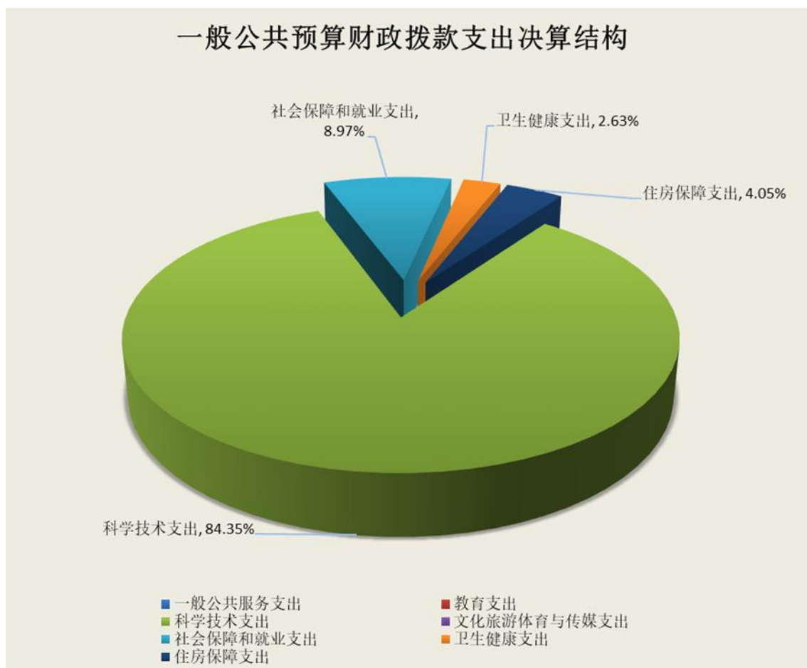
（图 6：一般公共预算财政拨款支出决算结构）（饼状图）