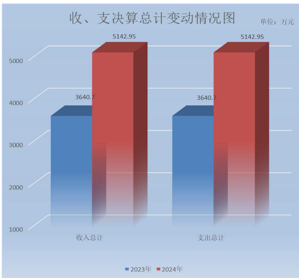
（图 1：收入、支出决算总计变动情况图）（柱状图）

2024 年度收入、支出总计均为 5142.95 万元。与 2023 年度相比，收入、支出总计各增加 1502.25 万元，增长 41.3%。主要变动原因是本年度新增文旅项目预算金额较大，均在本年度进行支出。