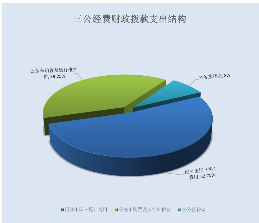
(图 7: “三公” 经费财政拨款支出结构) (饼状图)

1.因公出国(境)经费支出 6.33 万元, 完成预算 100%。 全年安排因公出国(境)团组 1 次, 出国(境) 1 人。因公出国(境)支出决算比 2023 年增加 6.33 万元, 增长 100%。主要原因是本年度为推广文旅合作项目进行因公出国出差发生费用。开支内容为: 前往英国、法国进行经贸合作项目拜访, 参加峨眉威士忌酒业海外推广活动, 展示峨眉山市酒类产品, 吸引文旅潜在合作机会。