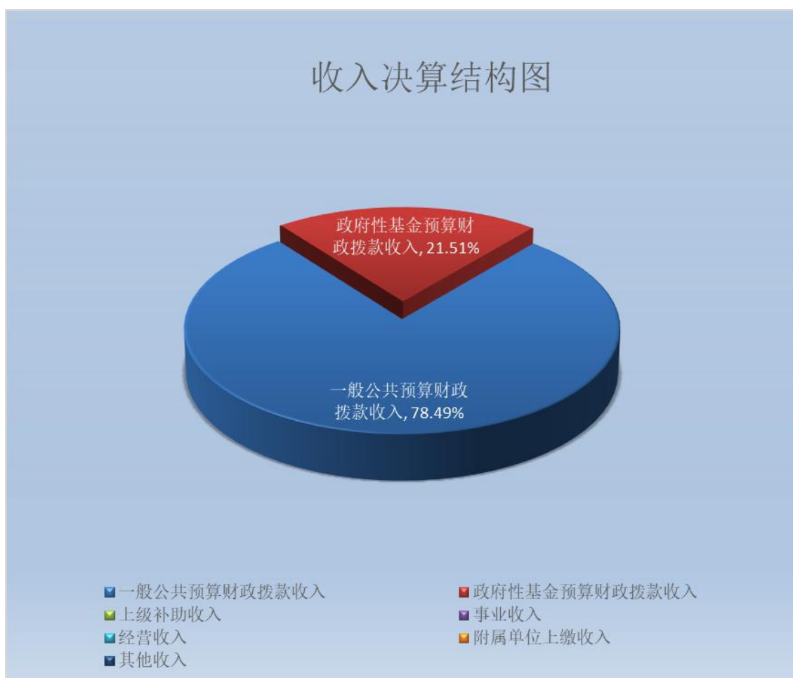
(图 2: 收入决算结构图) (饼状图)

预算财政拨款收入 3913.23 万元，占 78.5%；政府性基金预算财政拨款收入 1072.21 万元，占 21.5%；国有资本经营预算财政拨款收入 0 万元，占 0%；上级补助收入 0 万元，占 0%；事业收入 0 万元，占 0%；经营收入 0 万元，占 0%；附属单位上缴收入 0 万元，占 0%；其他收入 0 万元，占 0%。