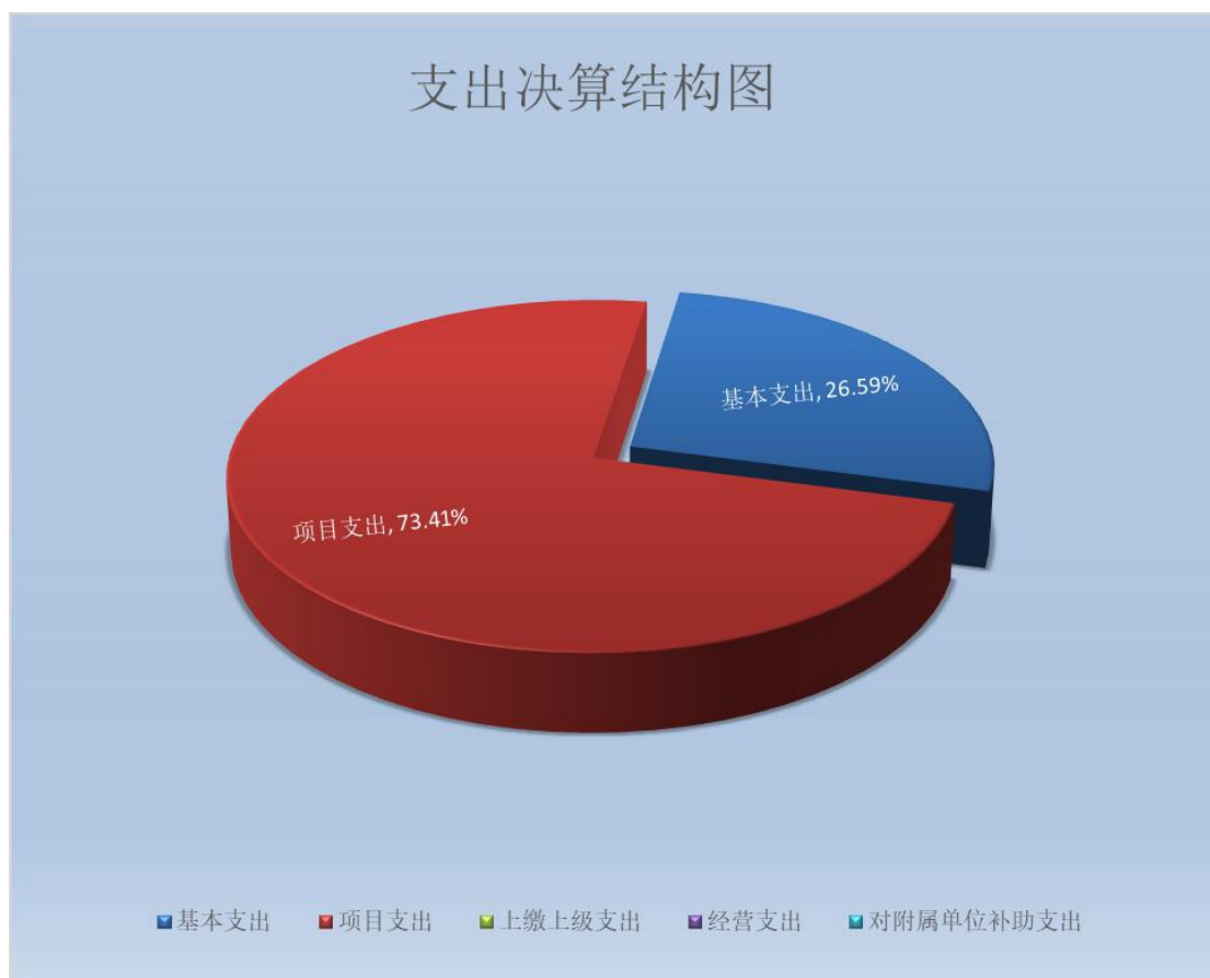
(图 3: 支出决算结构图)(饼状图)