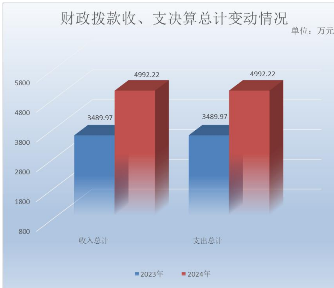
(图 4: 财政拨款收、支决算总计变动情况)(柱状图)