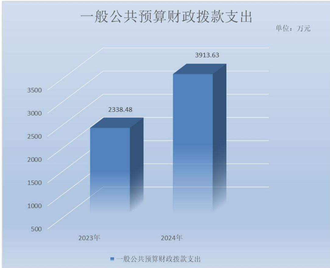
(图 5: 一般公共预算财政拨款支出决算变动情况)(柱状图)