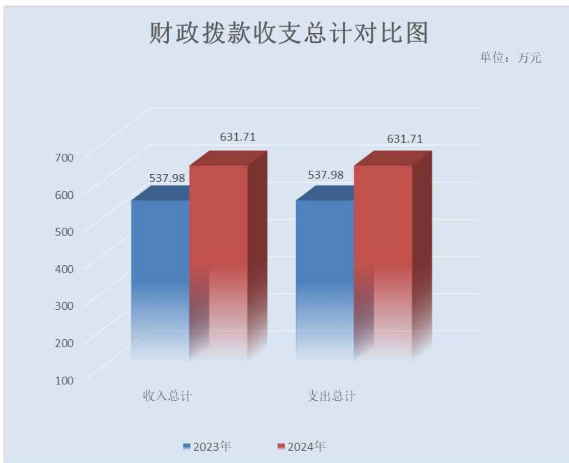
（图 4：财政拨款收、支决算总计变动情况）（柱状图）