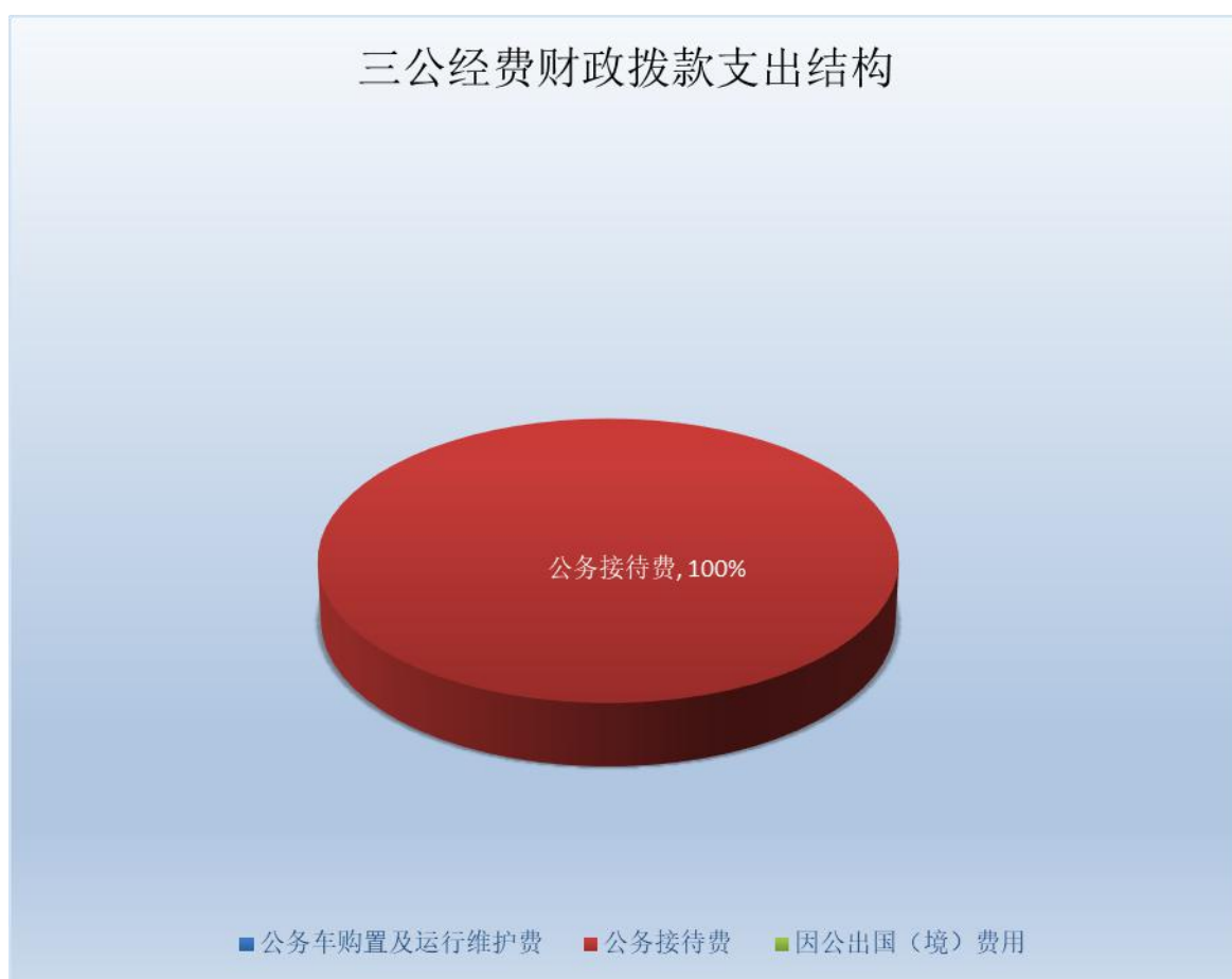
（图 7：“三公”经费财政拨款支出结构）（饼状图）

2024 年度“三公”经费财政拨款支出决算中，因公出国（境）费支出决算 0 万元，占 0%；公务用车购置及运行维护费支出决算 0 万元，占 0%；公务接待费支出决算 1.13 万元，占 100%。具体情况如下：