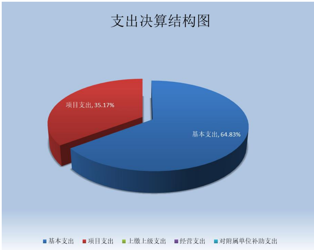
(图 3: 支出决算结构图) (饼状图)