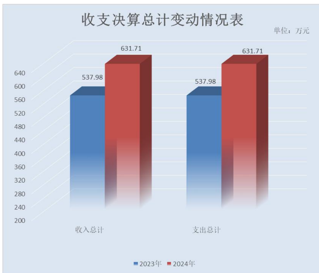
（图 1：收入、支出决算总计变动情况图）（柱状图）

2024 年度收入、支出总计均为 631.71 万元。与 2023 年度相比，收入、支出总计各增加 93.73 万元，增长 17.42%。主要变动原因是在职人员的增加和退休人员的去世。