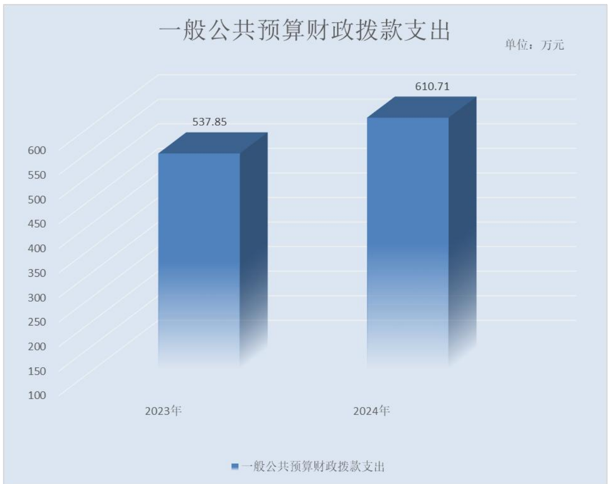
(图 5: 一般公共预算财政拨款支出决算变动情况)(柱状图)