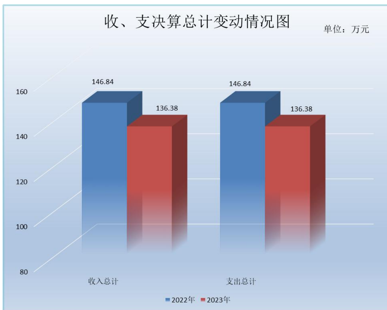
(图 1：收、支决算总计变动情况图) (柱状图)

2023 年度收、支总计均为 136.38 万元。与 2022 年度相比，收、支总计各减少 10.46 万元，下降 7.12%。主要变动原因是 2023 年新增退休人员一名。