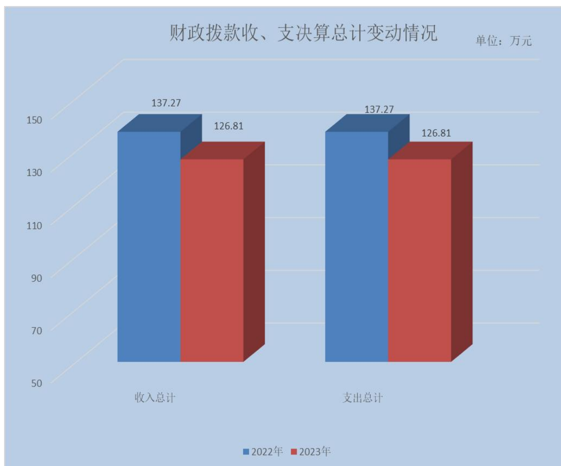
（图 4：财政拨款收、支决算总计变动情况）（柱状图）