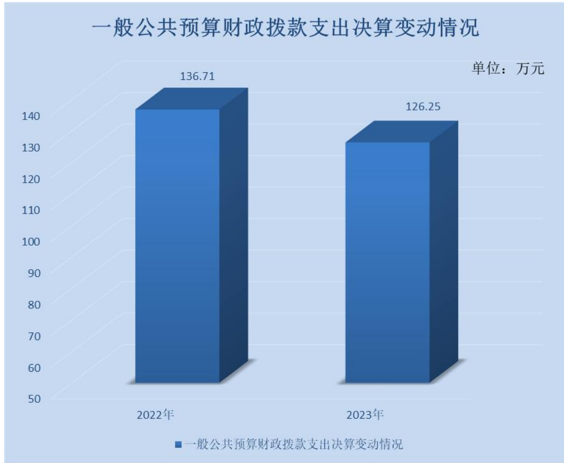
(图 5: 一般公共预算财政拨款支出决算变动情况)(柱状图)