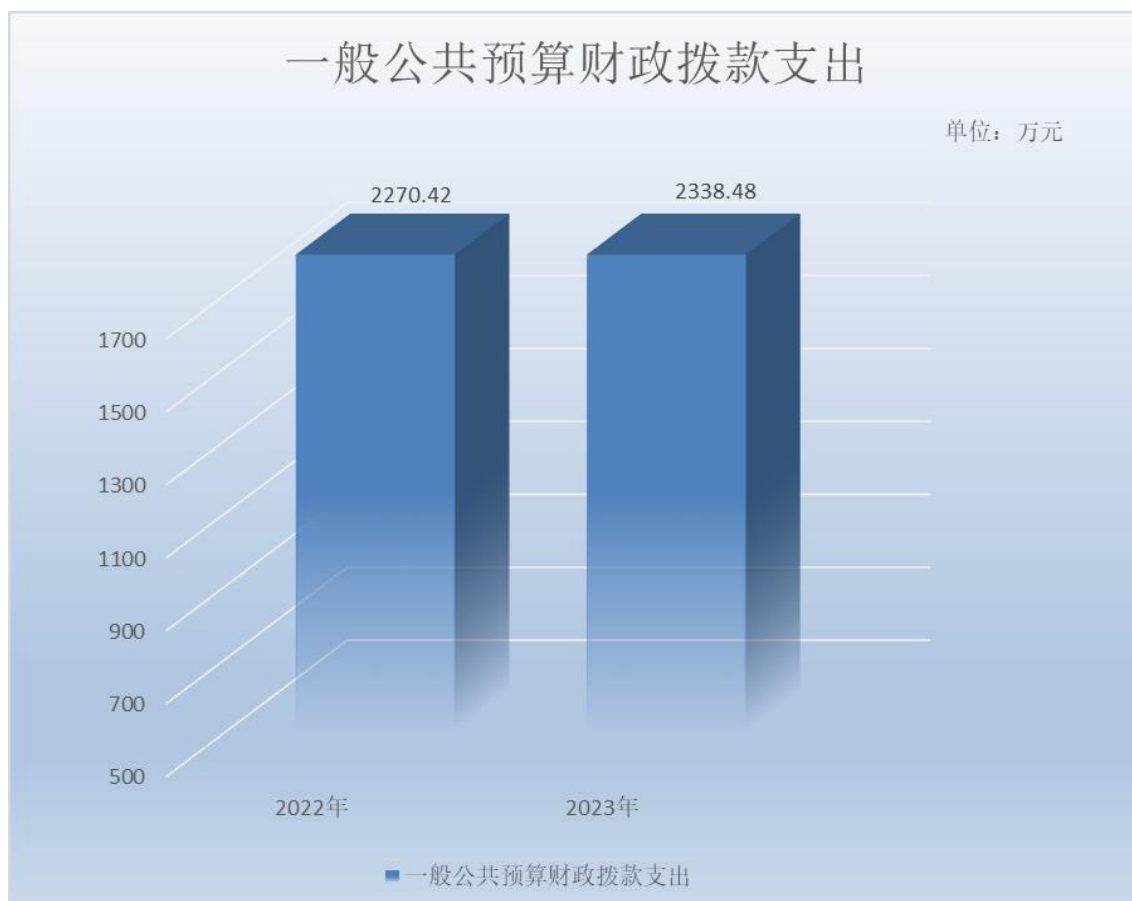
(图 5: 一般公共预算财政拨款支出决算变动情况)(柱状图)