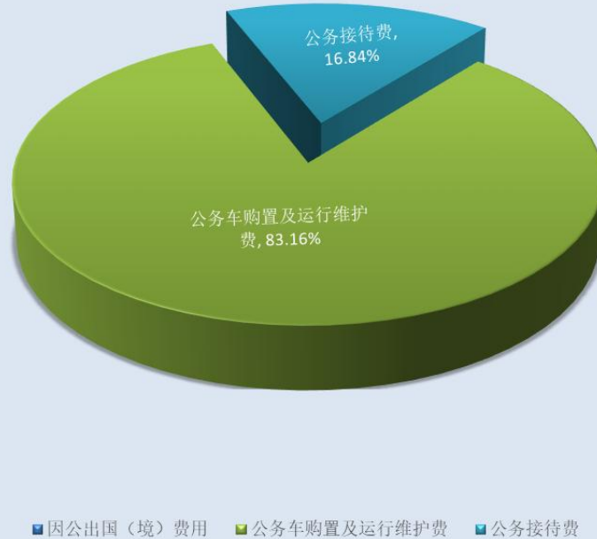
(图 7：“三公”经费财政拨款支出结构) (饼状图)

1. 因公出国(境)经费支出 0 万元, 完成预算 0%。全年安排因公出国(境)团组 0 次, 出国(境) 0 人。本年无此项经费支出。