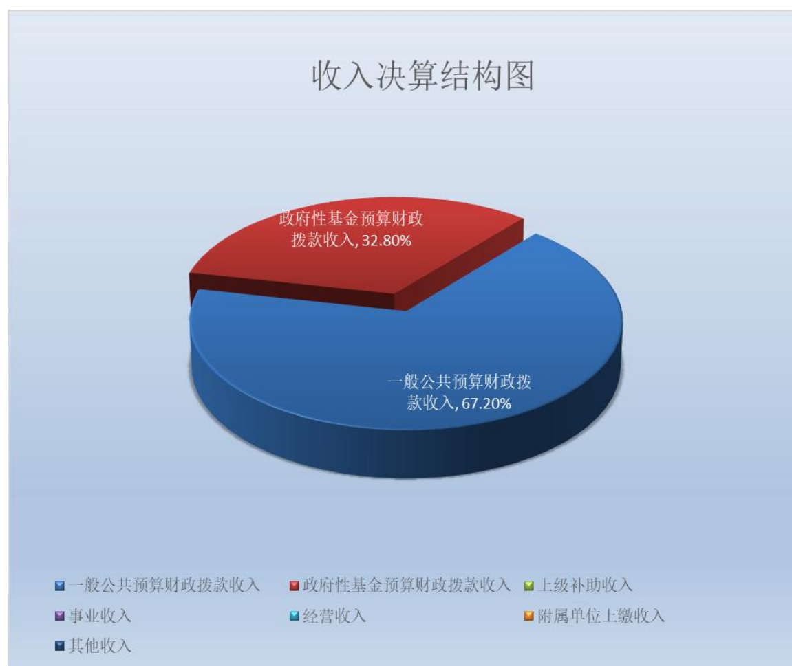
(图 2: 收入决算结构图) (饼状图)

2023 年度本年收入合计 3478.32 万元，其中：一般公共预算财政拨款收入 2337.48 万元，占 67.2%；政府性基金预算财政拨款收入 1140.84 万元，占 32.8%；国有资本经营预算财政拨款收入 0 万元，占 0%；上级补助收入 0 万元，占 0%；事业收入 0 万元，占 0%；经营收入 0 万元，占 0%；附属单位上缴收入 0 万元，占 0%；其他收入 0 万元，占 0%。