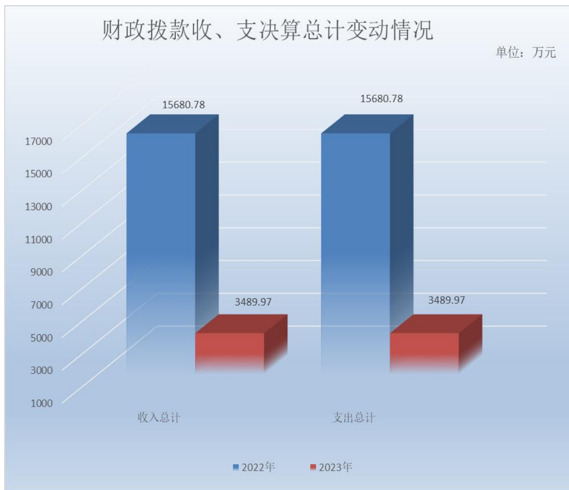
（图 4：财政拨款收、支决算总计变动情况）（柱状图）