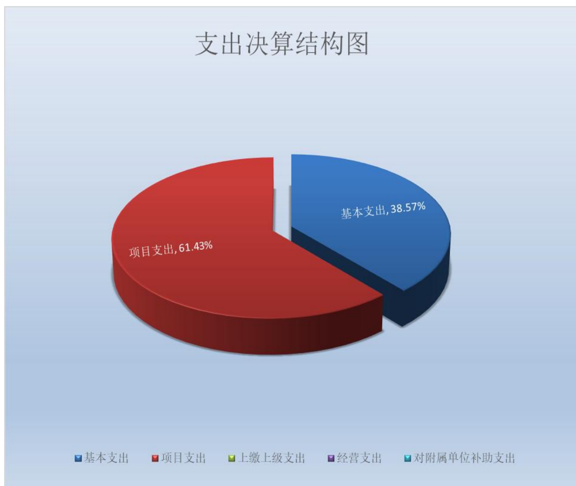
（图 3：支出决算结构图）（饼状图）

上缴上级支出 0 万元，占 0%；经营支出 0 万元，占 0%；对附属单位补助支出 0 万元，占 0%。