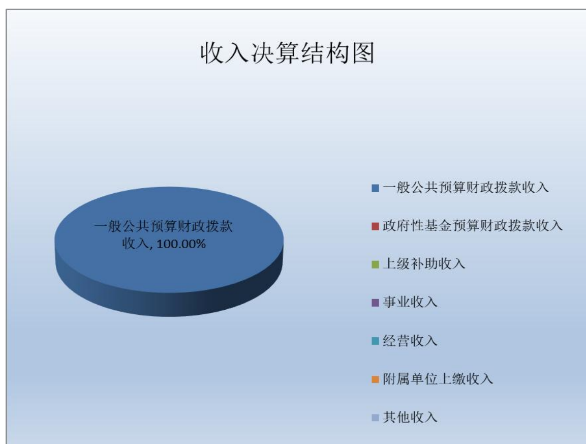
(图 2：收入决算结构图) (饼状图)

2023 年度本年收入合计 308.64 万元，其中：一般公共预算财政拨款收入 308.64 万元，占 100%；政府性基金预算财政拨款收入 0 万元，占 0%；国有资本经营预算财政拨款收入 0 万元，占 0%；上级补助收入 0 万元，占 0%；事业收入 0 万元，占 0%；经营收入 0 万元，占 0%；附属单位上缴收入 0 万元，占 0%；其他收入 0 万元，占 0%。