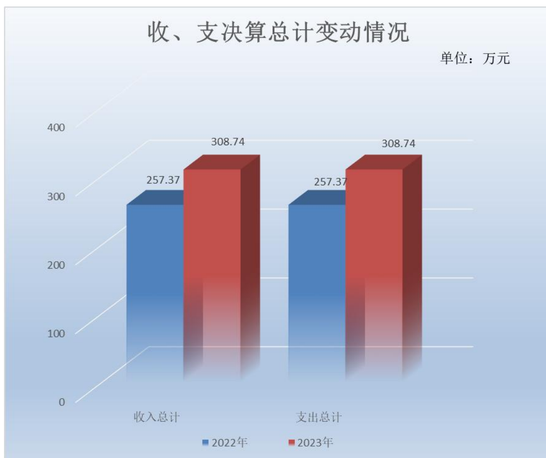
（图 1：收、支决算总计变动情况图）（柱状图）

2023 年度收、支总计均为 308.74 万元。与 2022 年度相比，收、支总计各增加 51.37 万元，增长 19.96%。主要变动原因是平时绩效工资增加，每年正常晋升。