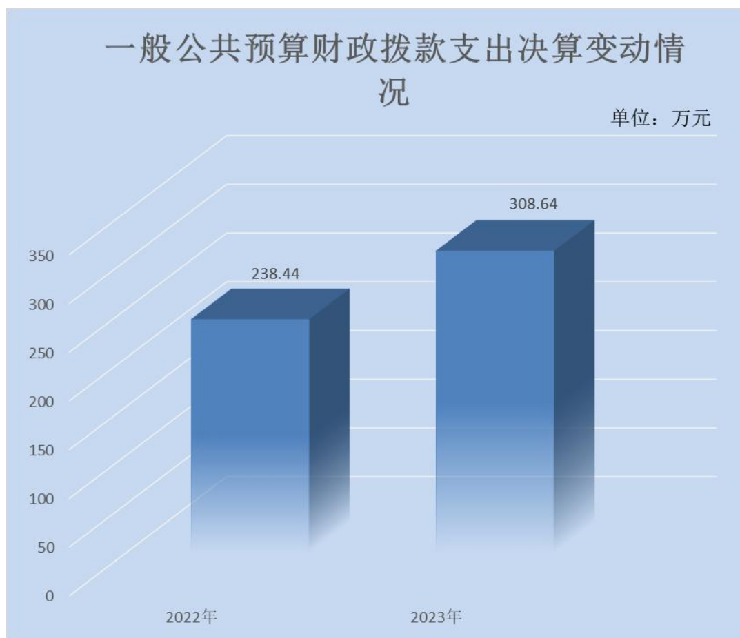
（图 5：一般公共预算财政拨款支出决算变动情况）（柱状图）