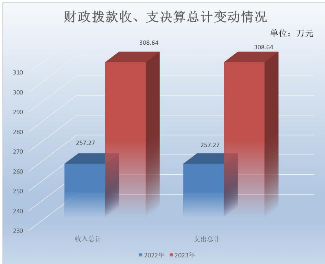
（图 4：财政拨款收、支决算总计变动情况）（柱状图）