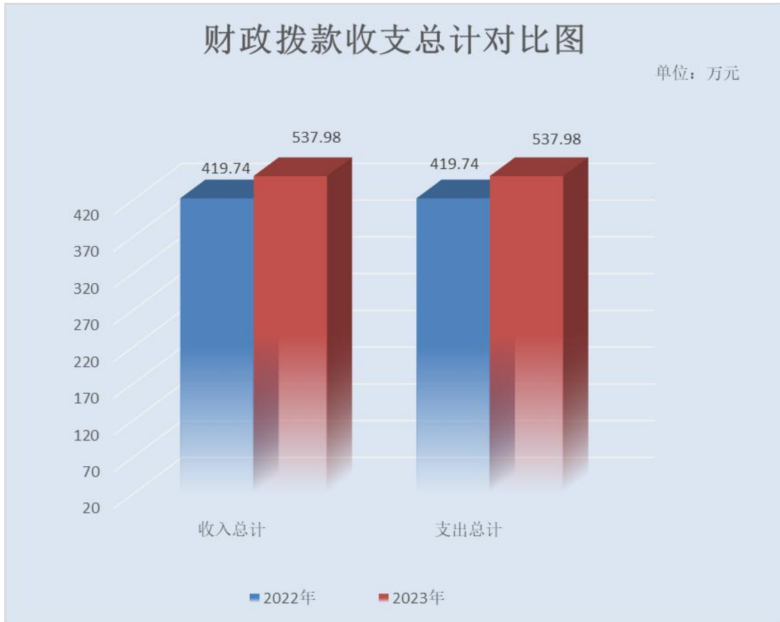
（图 4：财政拨款收、支决算总计变动情况）（柱状图）