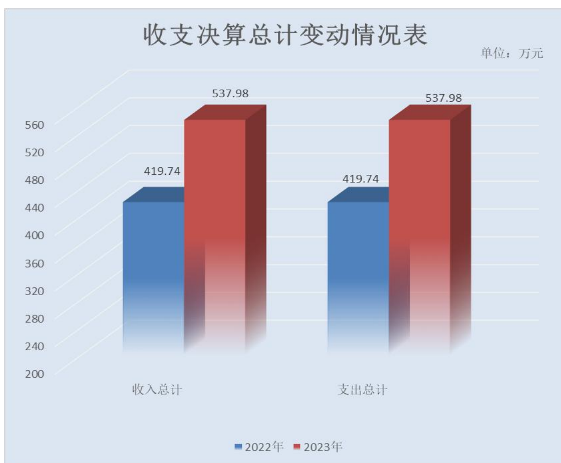
（图 1：收、支决算总计变动情况图）（柱状图）

2023 年度收、支总计均为 537.98 万元。与 2022 年度相比，收、支总计各增加 118.24 万元，增长 28.17%。主要变动原因是增加了人员。