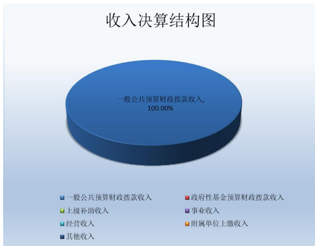
(图 2：收入决算结构图) (饼状图)

预算财政拨款收入 537.75 万元，占 100%；政府性基金预算财政拨款收入 0 万元，占 0%；国有资本经营预算财政拨款收入 0 万元，占 0%；上级补助收入 0 万元，占 0%；事业收入 0 万元，占 0%；经营收入 0 万元，占 0%；附属单位上缴收入 0 万元，占 0%；其他收入 0 万元，占 0%。