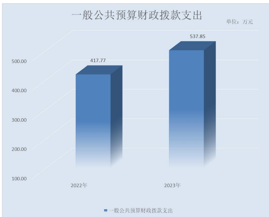
(图 5: 一般公共预算财政拨款支出决算变动情况)(柱状图)