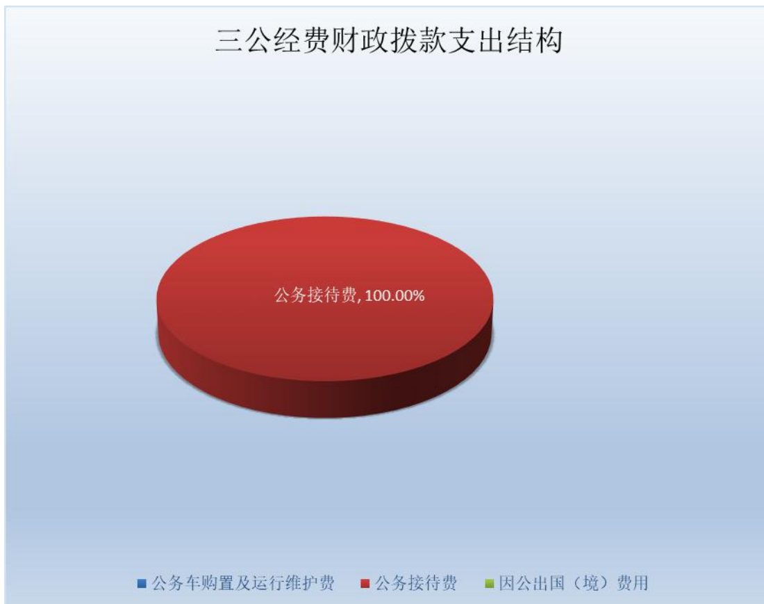
（图 7：“三公”经费财政拨款支出结构）（饼状图）

2023 年度“三公”经费财政拨款支出决算中，因公出国（境）费支出决算 0 万元，占 0%；公务用车购置及运行维护费支出决算 0 万元，占 0%；公务接待费支出决算 1.81 万元，占 100%。具体情况如下：